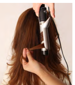
⑲⑳ 全体が完全に乾いたら、ツヤ感を出す為に5カ所程ランダムに引き出し、アイロンで巻きます。パーマの質感を残す為、表面に出てこない部分を厚めに取り、縦巻きで巻いていきます。アイロンを外した後、毛束を上下に引いてカールをほぐしておく、立体感と柔らかさが出ます。