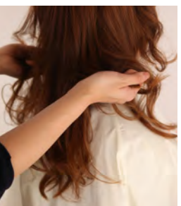
㉑ 仕上げにムースを下からもみこむように付けます。姫カットの部分はパーマのカール感をそのまま出すよりも、カールを崩して広げたり、毛先をランダムに跳ねさせたりすると顔周りが華やかになって可愛らしさがあります。