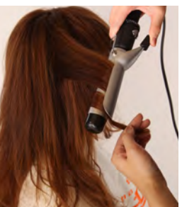
⑲⑳ 全体が完全に乾いたら、ツヤ感を出す為に5カ所程ランダムに引き出し、アイロンで巻きます。パーマの質感を残す為、表面に出てこない部分を厚めに取り、縦巻きで巻いていきます。アイロンを外した後、毛束を上下に引いてカールをほぐしておく、立体感と柔らかさが出ます。