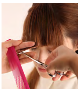
⑪ 前髪は左の黒目の上側1cm幅分が最も短くなるように設定し、眉上でカットします。そこから斜めに繋げて行きます。