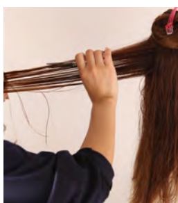
⑨ ミドルセクションを中間から間引いていきます。