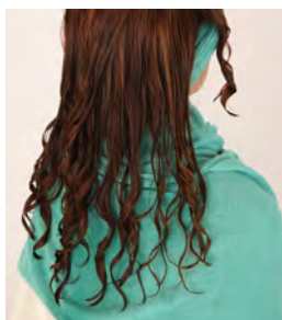
⑰ ロッドアウトの状態です。