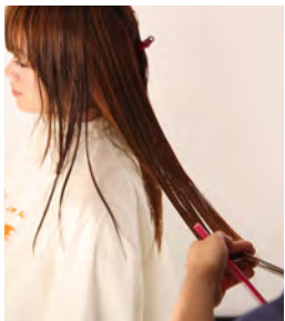
④ オーバーセクションも軽くなりすぎないように注意し、ローレイヤーでカットします。