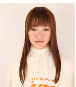
⑫ カットの終了です。