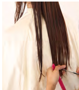
② アウトラインはなだらかな前上がりになるようにカットします。