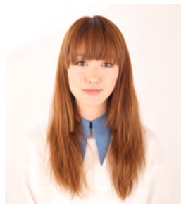
① 施術前の状態です。少しクセのある髪質で毛量は普通程度。カラーのダメージで毛先にパサつきがあります。