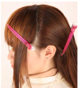
⑤ フェイスラインを姫カットにします。ブロッキングはもみあげから2cm上の位置に設定し、広めに取ります。