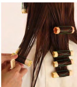
⑮ トップの1本のみ、うねりが出る程度のカールにしたいので、26mmロッドで中間まで巻きます。