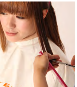
⑥⑦ 姫カットを作ります。下側に少しグラデーションを入れ、上側1/3にはレイヤーを入れます。この時、オーバードイレクションはかけずにオンベースで引き出してカットする事がポイントです。下にグラデーション、上にレイヤーが入る事で、姫カットの特長であるパツとしたカットラインと重さの中に、程良く軽さも出す事が出来ます。