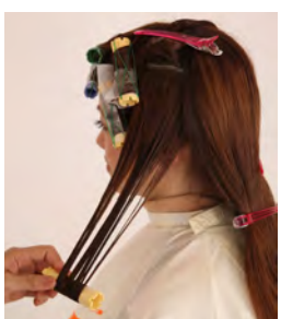
⑭ サイドとバックは23mmロッドでダウンステムで2回転巻きします。