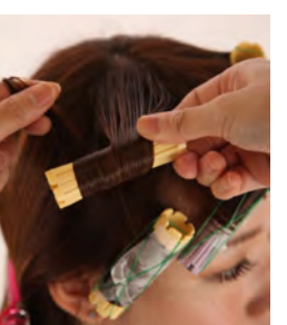
⑬ 姫カットの部分には強めのカールを付けたいため、23mmロッドで根元巻きにします。