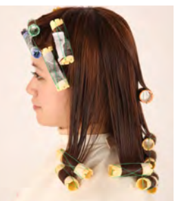
⑯ ワインディング終了です。アミノコスメカールHを塗布し、5分放置後中間処理剤と2液を塗布し、2度付けで7分間放置します。